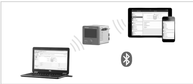
Drahtlose Verbindung zu Smartphone/Tablet/Notebook

Die Bedienung erfolgt über eine kostenfreie App aus dem "Apple App Store", dem "Google Play Store" oder dem "Baidu Store". Alternativ kann die Bedienung auch über PACTware/DTM und einen Windows-PC erfolgen.